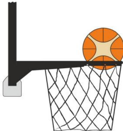
Diagrama 4 Balón dentro de la canasta

31-25 Afirmación: Es una violación de interferencia si un defensor toca el balón mientras el balón está dentro de la canasta.