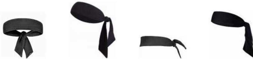
Diagrama 1. Ejemplos de cintas para el pelo tipo bufanda

4-4 Afirmación: No se permite llevar cintas para el pelo tipo bufanda.