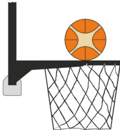
Diagrama 3 Balón en contacto con el aro

31-20 Afirmación: Es una violación de interferencia si un defensor o un atacante, durante un tiro, toca la canasta (aro o red) o el tablero mientras el balón está en contacto con el aro y aún tiene posibilidad de entrar en la canasta.