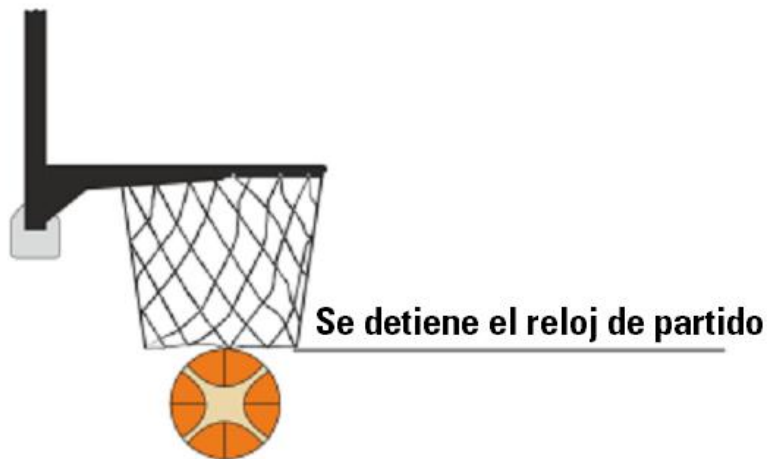
Diagrama 2. Tiro convertido

16-15 Ejemplo: Cuando quedan 2:02 para el final del último cuarto, A1 consigue una canasta al atravesar el balón el cesto. Cuando quedan 2:00, B1 está preparado para sacar detrás de la línea de fondo.